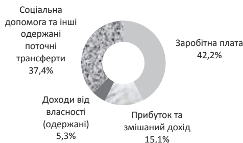
Рис. 1. Структура доходів населення у 2012 р.

Виклад основного матеріалу дослідження. Визначальним чинником попиту споживачів є рівень доходів населення. Протягом останніх років структура доходів населення залишалася майже незмінною. Станом на 2012 р., як і раніше, домінуючі позиції в ній посідали заробітна плата (близько 43%) і соціальні виплати (близько 38%) (рис. 1).