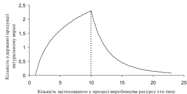
Рис. 3. Ефективність використання ресурсу i -го типу на конкретному етапі виробництва