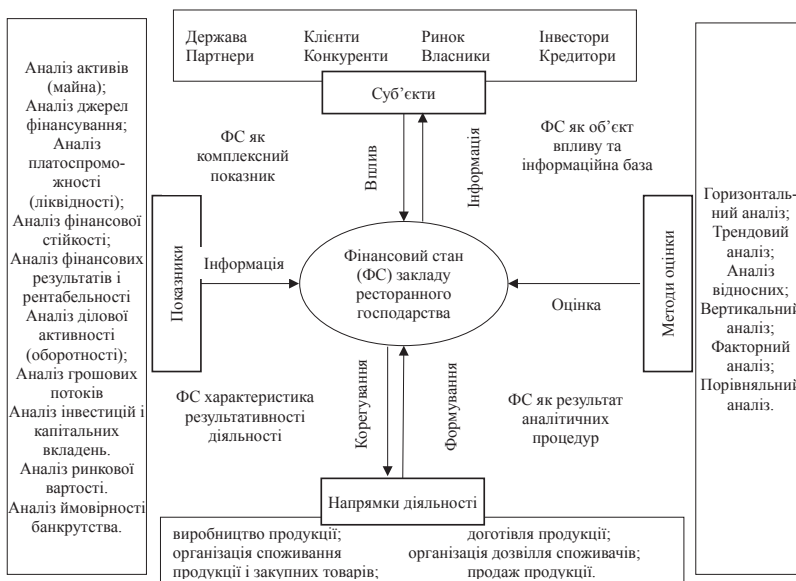
Рис. 2. Характерні риси, притаманні поняттю фінансового стану закладу ресторанного господарства

фінансової звітності численних суб'єктів господарювання ресторанного бізнесу засвідчує, що традиційні методи та прийоми фінансового аналізу у повній мірі використовуються для цієї категорії господарюючих суб'єктів. Таким чином, показниками фінансового стану закладів ресторанного господарства є коефіцієнти ліквідності, рентабельності, фінансової стійкості, інвестиційної привабливості, оборотності, ділової активності. А це означає, що, обравши науковий підхід до визначення фінансового стану суб'єкта як сукупності показників його діяльності, можемо запропонувати таку дефініцію: фінансовий стан закладу ресторанного господарства – це комплекс показників, що характеризують різні аспекти його фінансово-господарської діяльності та надають підсумкову оцінку рівня його конкурентоспроможності, економічної безпеки та перспектив подальшого розвитку.