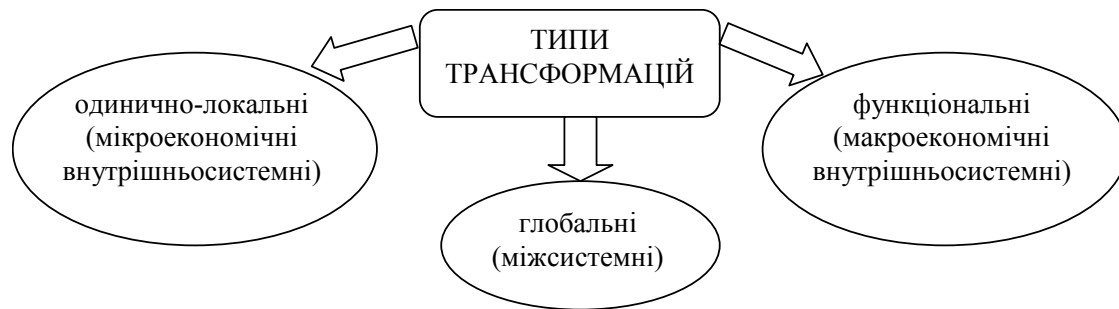
Рис. 1. Основні типи галузевих трансформацій у національного господарського комплексу України

При цьому треба мати на увазі, що адміністративно-територіальний устрій в Україні значно відрізняється від існуючого в Європі, насамперед, через великі розміри території. Під регіоном найчастіше мають на увазі адміністративну область, як основну ланку адміністративно-територіального поділу та регулювання соціально-економічних процесів. Водночас, регіони – адміністративні області або компактно