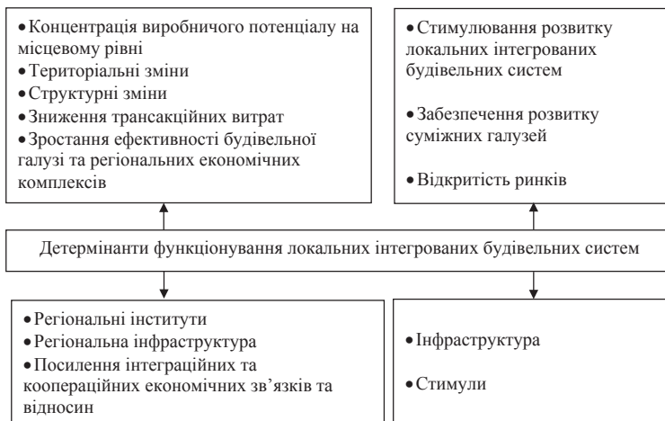
Рис. 1. Маркетингове середовище функціонування локальних інтегрованих будівельних систем (розроблено автором)

Головним завданням розробки і реалізації маркетингових програм розвитку регіональних будівельних кластерів вважаємо створення сприятливого для цього ринкового середовища за для заохочення усіх суб'єктів, причетних до формування і розвитку в регіонах нашої держави кластер-