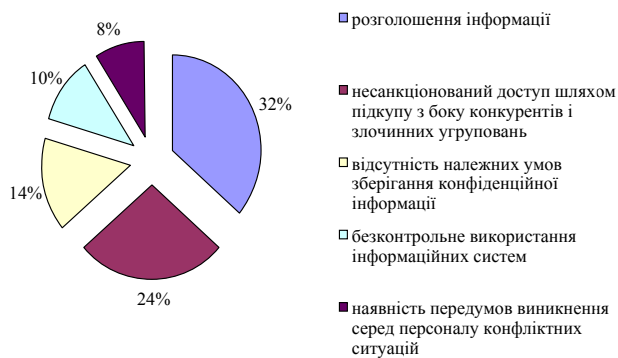
Рис. 2. Результати дослідження світових загроз кадровій безпеці за даними порталу Content Security [9]

Згідно з даними порталу Content Security, внутрішні та зовнішні світові загрози кадровій безпеці розподіляються на 5 основних груп, що наведені на рис. 2.