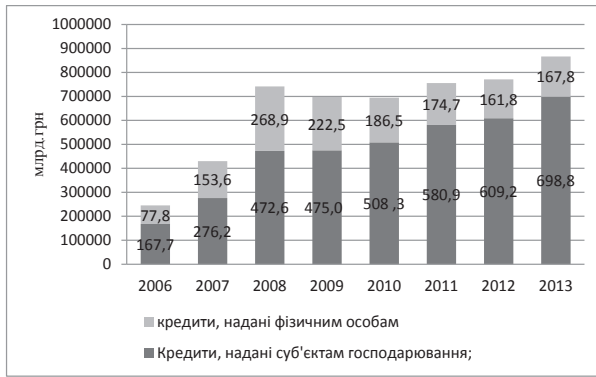
Рис. 2. Кредити, надані комерційними банками України суб'єктам господарювання та фізичним особам у 2006-2013 рр., млрд. грн.

Джерело: розроблено автором на основі [6]