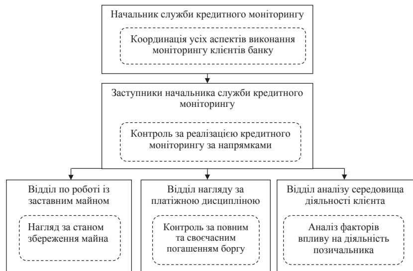
Рис. 2. Узагальнена структура служби кредитного моніторингу банку

Як можна побачити з узагальненої організаційної структури служби кредитного моніторингу банку (рис. 2) роботу зі спостереження за кредитним процесом організовано за конкретними напрямками. Кожен відділ виконує власні функції, які визначають його роль у загальній структурі. Координація роботи у