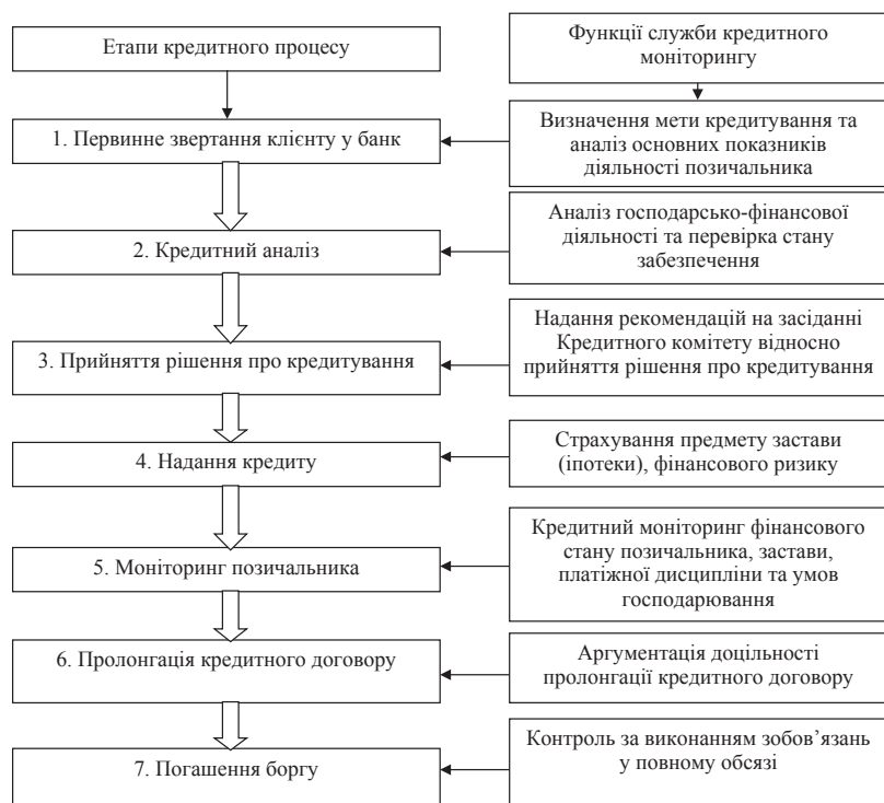
Рис. 3. Функції служби кредитного моніторингу у процесі кредитування