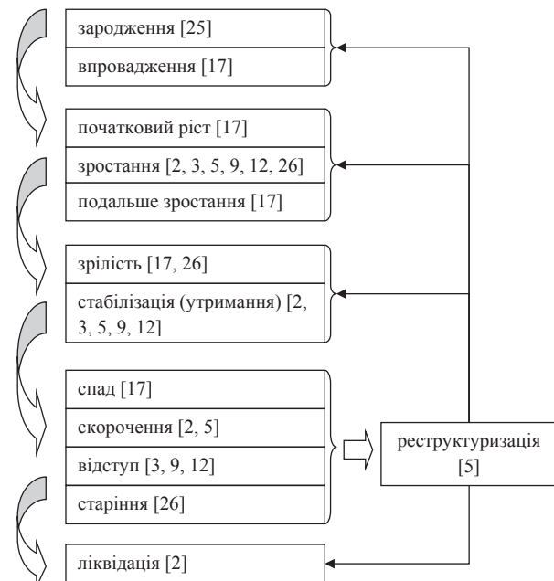
Рис. 1. Структурно-логічний взаємозв'язок стадій життєвого циклу об'єкта стратегічного управління

На основі джерел [2; 3; 5; 9; 12; 17; 25; 26] було узагальнено та розроблено наступну систему стадій життєвого циклу (рис. 1).