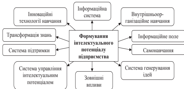
Рис. 1. Елементи формування інтелектуального потенціалу підприємства [6, с. 5]

Науковці І.П. Кузьменко та М.М. Зуєва [6, с. 5-6] пропонують моделі формування інтелектуального потенціалу на загальнонаціональному, регіональному рівнях і для окремого підприємства. Вони зазначають, що на рівні підприємства ключова роль у даних процесах належить постійному навчанню працівників. Основні елементи запропонованої авторами моделі представимо на рис. 1.