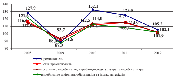
Рис. 1.2. Динаміка темпів зростання (спаду) обсягів реалізації продукції підприємств легкої промисловості в Україні за 2008–2012 рр.

Аналіз даних показує, що в 2009 р. в у діяльності підприємств швейної промисловості, що подолали кризу, пов'язану з переходом країни на ринкові відносини, спостерігаються позитивні тенденції. Однак у 2005–2009 рр. обсяги виробництва швейної продукції знижувалися. Найнижчого значення індекс обсягів швейного виробництва досяг у 2009 році і становив 72% до попереднього року. Аналогічні показники простежуються у легкій промисловості та промисловості загалом.