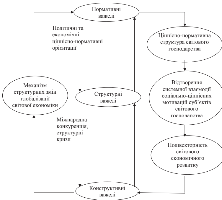
Рис. 1. Функціональні особливості механізму структурних змін глобалізації світової економіки

– розширення національних і міжнародних фінансових резервів стабілізаційних фондів, проведення прогнозу світового технологічного розвитку;