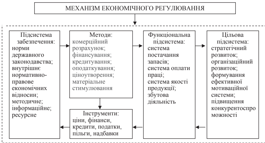
Рис. 1. Структура механізму економічного регулювання підприємств легкої промисловості