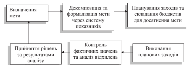
Рис. 3. Контролінг як технологія управління [16]

Доктор економічних наук, професор, провідний російський дослідник у сфері економіки, менеджменту та організації виробництва запропонував схему контролінгу як технології управління (рис. 3).