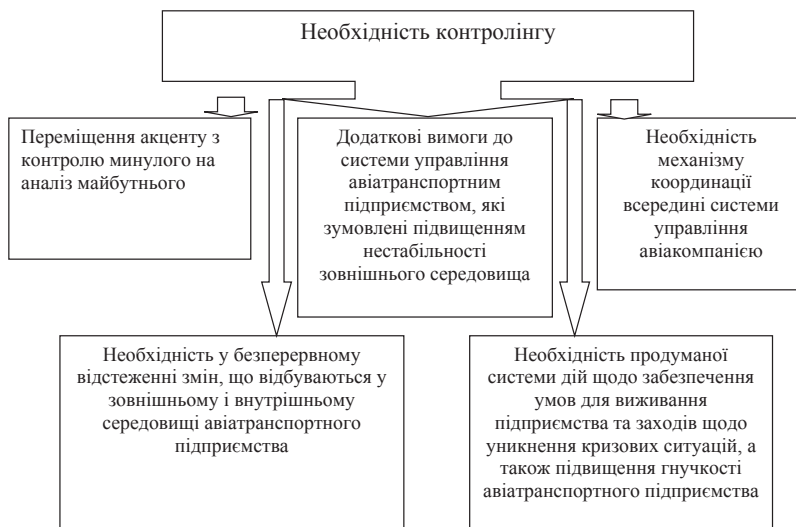
Рис. 5. Необхідність контролінгу на сучасних авіатранспортних підприємствах

Отже, можна зазначити, що головною метою організації контролінгу на авіатранспортному підприємстві є, перш за все, орієнтація управлінського процесу на досягнення всіх цілей, які постають перед авіакомпанією.