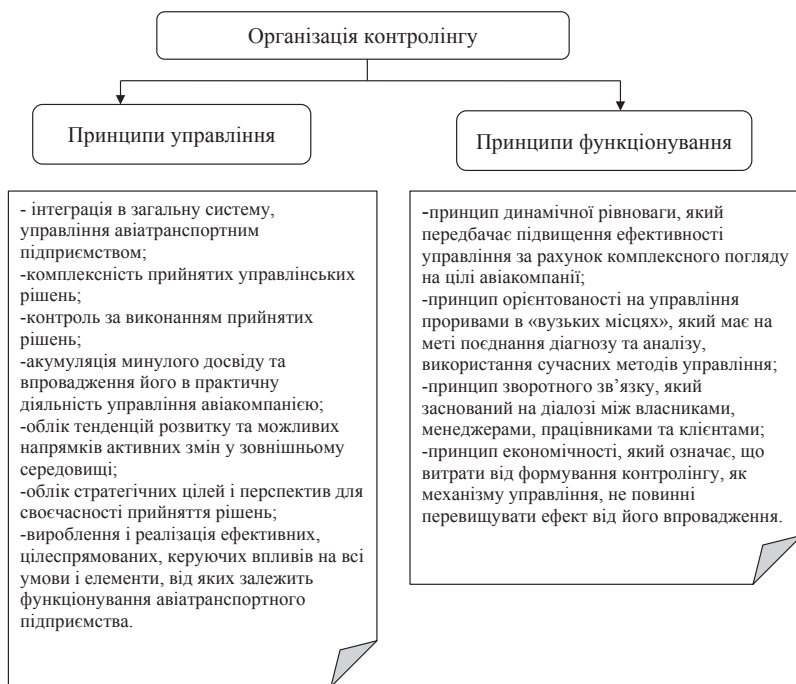
Рис. 4. Принципи управління та принципи функціонування системи контролінгу в авіакомпанії