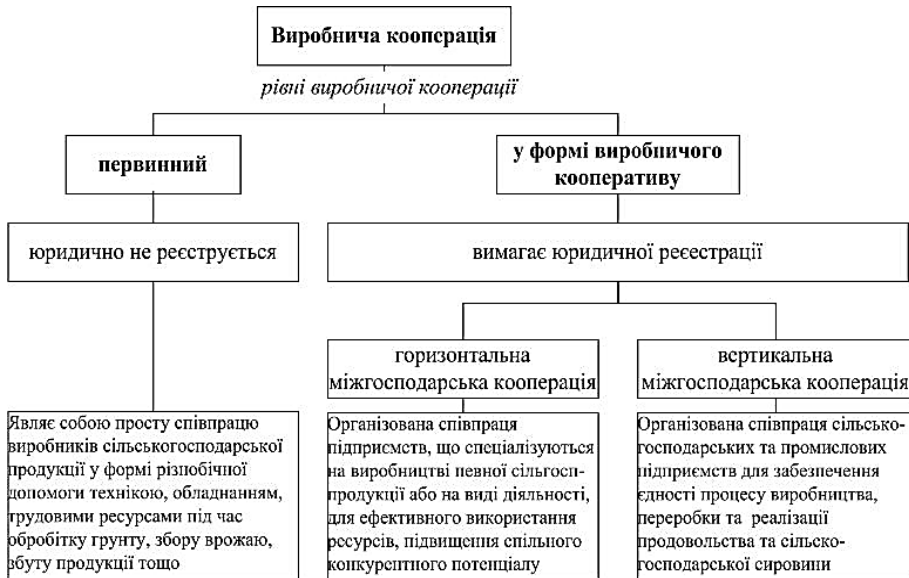
Рис. 1. Сучасний розвиток виробничої кооперації в Україні

Вищою формою виробничої кооперації є створення сільськогосподарського виробничого кооперативу як добровільного об'єднання осіб на основі членства для сумісної виробничої і іншої господарської діяльності, заснований на їх особистій трудовій участі і об'єднанні їх майнових пайових внесків. М. Малік вказує на те, що виробничий кооператив виник шляхом повної інтеграції господарств-членів кооперативу в єдине підприємство, в якому об'єднуються спільні індивідуальні зусилля. Унаслідок цього виробничий кооператив є найбільш інтенсивною формою згуртованості й вищим ступенем інтеграції в кооперативному секторі. Чле-