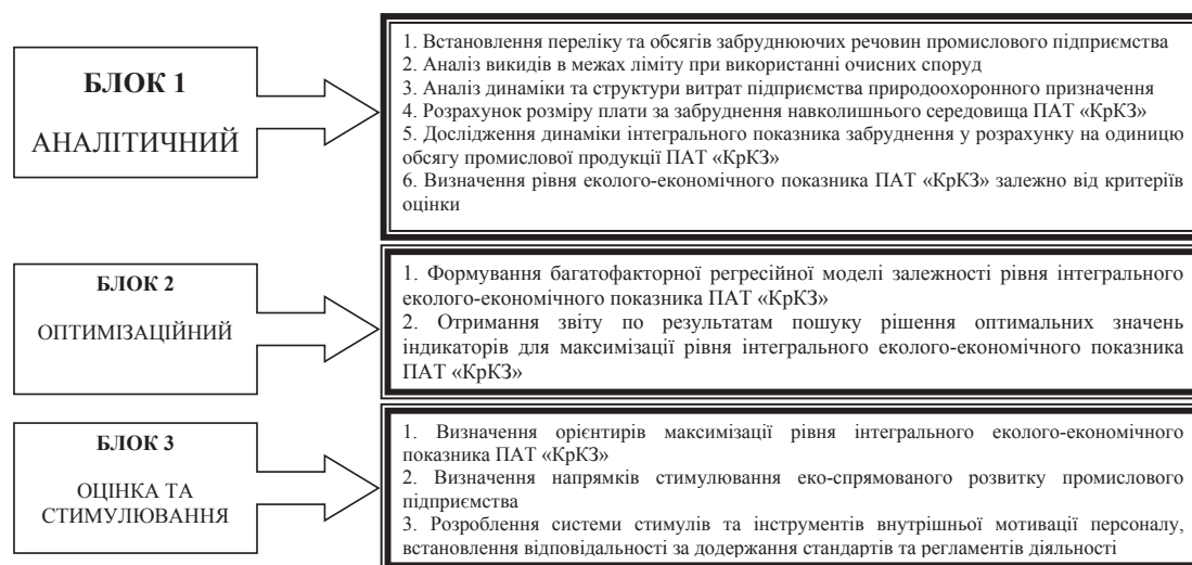
Рис. 1. Концептуальна схема механізму стимулювання екологізації промислового підприємства

Для підвищення ефективності захисту навколишнього середовища ПАТ «КрКЗ» – спеціалізованого підприємства з виробництва коліс, можливо скористатися цим досвідом і проводити поетапне удосконалення виробничих процесів, технології та обладнання з урахуванням екологічних критеріїв. Аналіз діяльності підприємства показав, що у 2010 році фінансування технологічних інновацій за напрямом виробничого проектування, інші види підготовки виробництва для випуску нових продуктів, впровадження нових методів їх виробництва складало лише 4,7%. Протягом 2012-2013 рр. питома вага збільшилася до 74,8 та 58,47%. Ця стадія для підприємства є дуже важливою і відносно самостійною, бо залежить суто