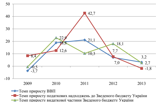
Рис. 2. Динаміка видаткової частини та податкових надходжень Зведеного бюджету України та ВВП, %

А. Крисоватий підкреслює, що «...справляння податків, в контексті політики державних доходів, не самоціль державницької діяльності, а цілеспрямована суспільна інтуїція, направлена на задоволення інтересів членів суспільства, тобто оподаткування має бути суспільно спрямованим на фінансування витрат держави, пов'язаних з виконанням державою покладених на неї функцій» [3, с. 93]. Динаміка темпів приросту податкових надходжень та видатків Зведеного бюджету України та ВВП показана на рис. 2.