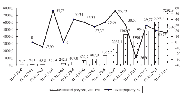
Рис. 3. Динаміка фінансових ресурсів Фонду за 2000-2013 роки, млн. грн. [9]

Склад джерел формування коштів Фонду гарантування впродовж досліджуваного періоду дещо змінювався. Загальний обсяг фінансових ресурсів Фонду з 2000 року по 2014 рік зріс більше ніж у 144 рази (рис. 3).