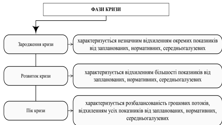
Рис. 1. Фази (стадії) кризи

Сучасне визначення поняття криза представлено у словнику Вебстера, який трактує її як «поворотний момент до кращого або гіршого», як період діяльнос-