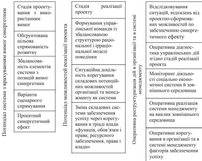
Рис. 1. Фрагмент проектування потенціалу системи з врахуванням вимог синергетики та потенційних можливостей його реалізації