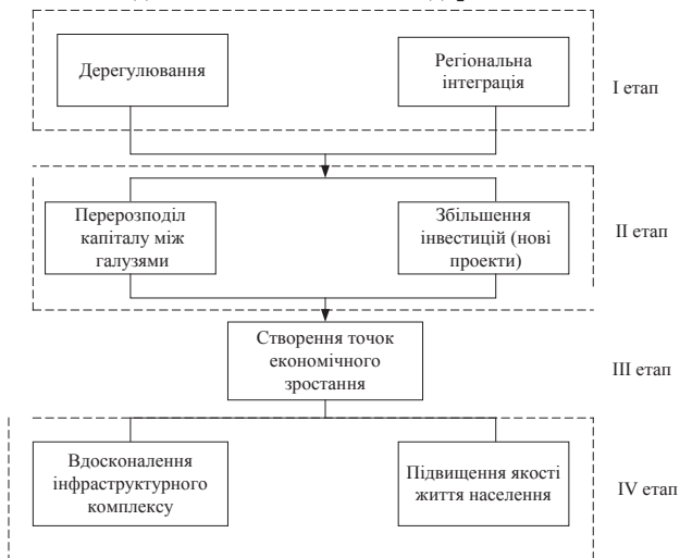
Рис. 3. Взаємозв'язок між результатами реформування моделі економіки України

Дерегулювання створює умови для поживлення економічного розвитку країни та її регіонів, проте його заходи обмежені межами державної політики