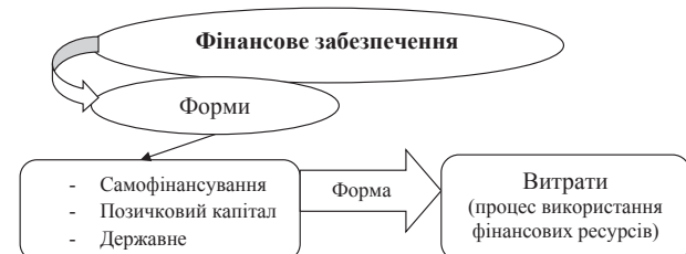
Рис. 1. Схема системи фінансового забезпечення інноваційної діяльності

В основі системи фінансування інноваційної діяльності лежить механізм її фінансового забезпечення. Досить часто поняття фінансування і фінансове забезпечення ототожнюють, зокрема В.Г. Щербак, О.В. Мелень не виокремлюють різниці між структурою фінансового забезпечення та структурою фінансування [14]. В дійсності ці терміни є досить близькими, однак все ж необхідно їх розділяти. В економічній літературі існують різні погляди щодо визначення фінансового забезпечення та фінансування.