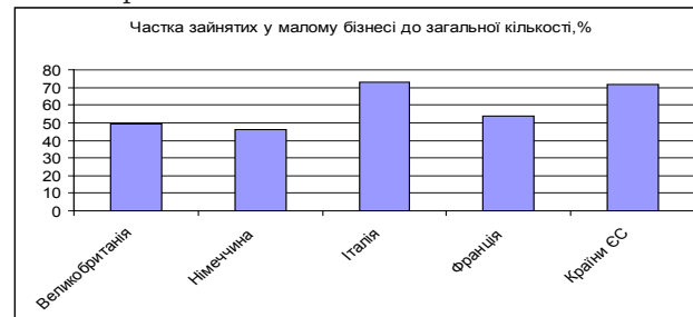
Рис. 3. Частка зайнятих працівників у малому бізнесі до загальної кількості зайнятих станом на 2014 р.

Якщо аналізувати показник частки зайнятих працівників у малому бізнесі до загальної кількості, то серед наведених країн основна тенденція спостерігається в межах 50% окрім Італії (73%), показник якої наближений до середньостатистичного показника по Європі.