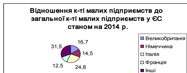
Рис. 1. Відношення кількості малих підприємств провідних країн ЄС до загальної кількості малих підприємств ЄС станом на 2014 р.

Враховуючи дані, наведені вище, станом на 2014 рік – серед провідних країн ЄС найбільше малих підприємств зареєстровано в Італії, що викликано значним залученням активного населення у сферу ресторанного бізнесу, туризму, а також у сфері послуг. Відповідно до загальної кількості малих підприємств в ЄС, у Великобританії 16,7% малих підприємств, у Німеччині – 14,5%, у Італії – 24,8%, у Франції – 12,5%.