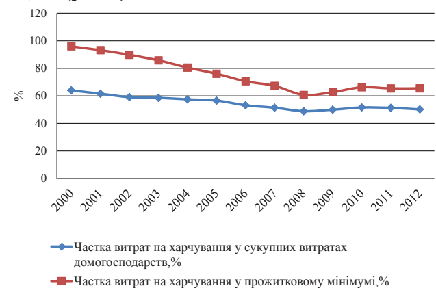
Рис. 3. Динаміка частки витрат на харчування у сукупних витратах домогосподарств та у прожитковому мінімумі, %

51% вартості всього споживчого набору, а в бідних сім'ях, де сукупні витрати дорівнюють прожитковому мінімуму, такий показник зростає до позначки 65,5% (рис. 3).