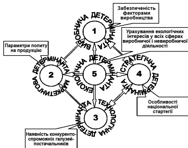
Рис. 1.1. Екологічно безпечна стратегія конкурентних переваг [11]

6) випадкові обставини – зміни умов інвестування, інновації, природно-кліматичні умови, що призводять до коливань витрат виробництва національної продукції щодо світового рівня [11].