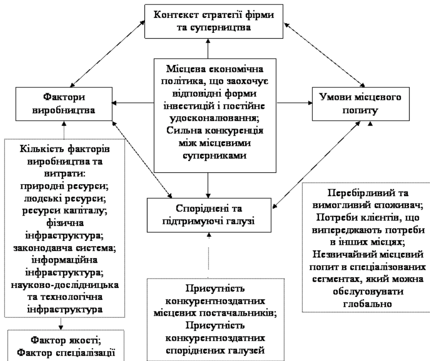
Рис. 1.2. Джерела локальних конкурентних переваг («Діамант М. Портера») [11, с. 273]

Їм же розроблена система детермінант конкурентної переваги країн, що отримала назву «конкурентний ромб» (або «діамант») за кількістю основних груп таких переваг. До них відносяться: факторні умови: людські та природні ресурси, науково-інформаційний потенціал, капітал, інфраструктура, у тому числі фактори якості життя; умови внутрішнього попиту: якість попиту, відповідність тенденціям розвитку попиту на світовому ринку, розвиток обсягу попиту; суміжні та обслуговуючі галузі (кластери галузей): сфери надходження сировини та напівфабрикатів, сфери надходження устаткування, сфери використання сировини, устаткування, технологій; стратегія та структура фірм, внутрішньогалузева конкуренція: цілі, стратегії, способи організації, менеджмент фірм, внутрішньогалузева конкуренція. Крім того, існують дві додаткові змінні, що у значній мірі впливають на обстановку в країні. Це випадкові події (тобто ті, які керівництво фірм не може контролювати) і державна політика [9; 12, с. 250].