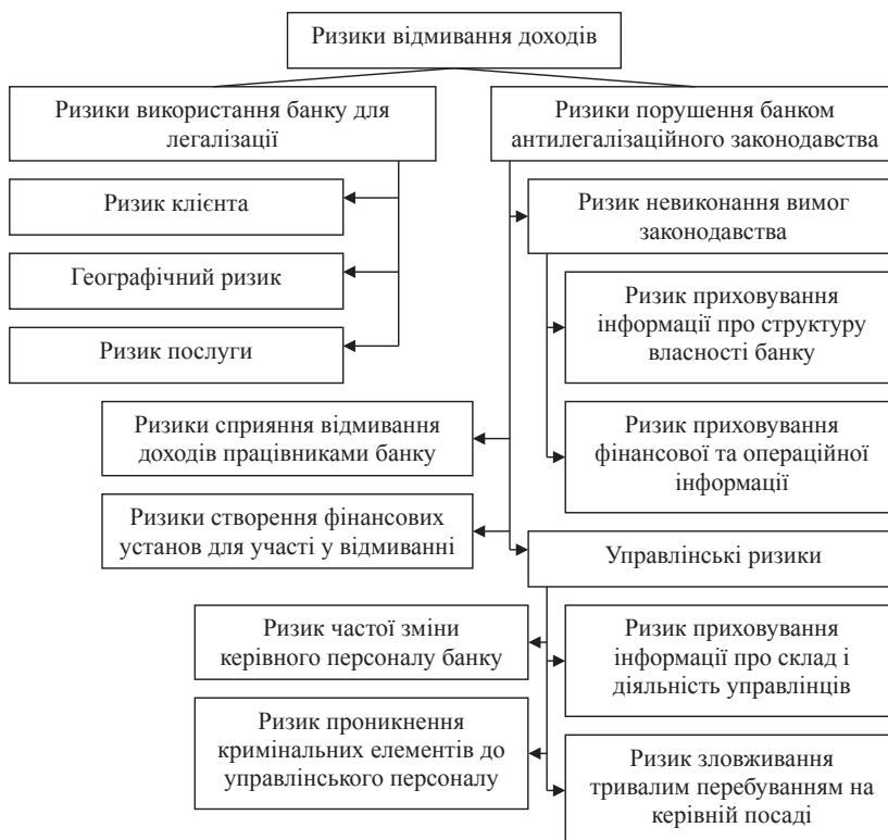
Рис. 2. Класифікація ризиків легалізації злочинних доходів у банківській сфері

Крім цього, згідно зі ст. 15 Закону «Про запобігання та протидію легалізації (відмиванню) доходів, одержаних злочинним шляхом, або фінансуванню тероризму» від 28.11.2002 р. № 249-IV, зазначено, що обов'язковому фінансовому моніторингу має підлягати переказ коштів на рахунок, відкритий у фінансовій установі в країні, в країні, що віднесена Кабінетом Міністрів України до переліку офшорних зон. Перелік офшорних зон визначено згідно з розпорядженням КМУ «Про перелік офшорних зон» від 23.02.2011 р.