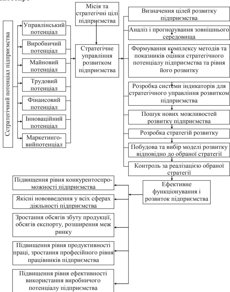
Рис. 3. Система стратегічного управління розвитком підприємства