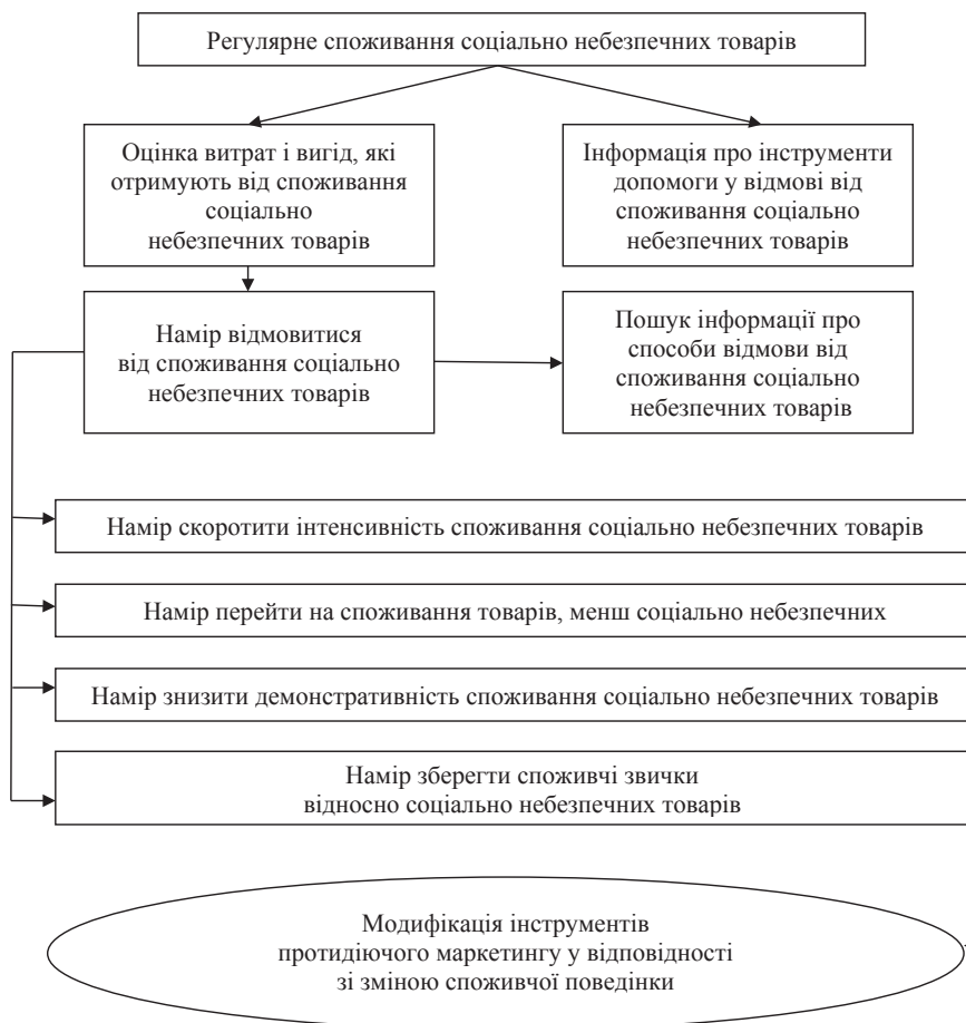
Рис. 3. Третя стадія – «Реакція на протидіючий маркетинг» – моделі споживчої поведінки на ринку соціально небезпечних товарів

Крім того, на рівень і склад ірраціональної поведінки й попиту впливають маркетингові заходи виробників соціально небезпечних товарів, що мають риси маніпулятивного маркетингу, ідеологія якого виходить із непрямого припущення про те, що під достатнім тиском попит можна привести до вимог пропозиції, а не навпаки. Серед заходів такого маркетингу виробники можуть використовувати вживання прийомів, що експлуатують імпульсивну поведінку людей; рекламу, що перебільшує властивості продукту, і очікування, пов'язані з цими властивостями; рекламу, що експлуатує біль і стурбованість людей; надання споживачам помилкової або неточної інформації відносно цін;