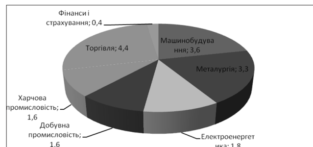
Рис. 1. Збитки в промисловості Донецької області за галузями виробництва у I півріччя 2014 року, млрд грн (авторський рисунок)

Згідно зі статистикою, за перше півріччя 2014 року в діяльності східноукраїнських підприємств відбулися такі тенденції. Промислове виробництво в регіоні зменшилося майже у всіх основних видах промислової діяльності [13]. У цій галузі понесені збитки більші, ніж за перше півріччя прибуток, на 11,8 млрд грн. Прикладом такого підприємства, на жаль, є Авдіївський коксохімічний завод, який поніс збитки від надзвичайної ситуації. Значення від'ємного фінансового результату за галузями промисловості можемо побачити на рисунку 1.