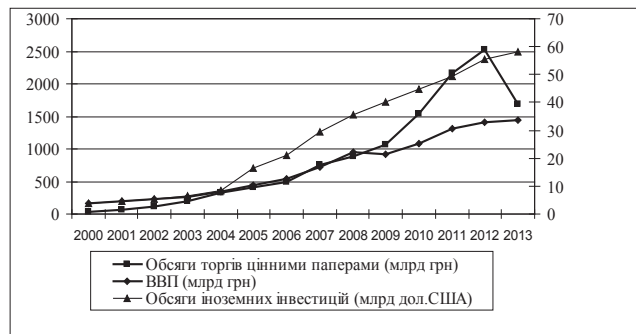
Рис. 2. Вихідні дані для побудови багатофакторної моделі