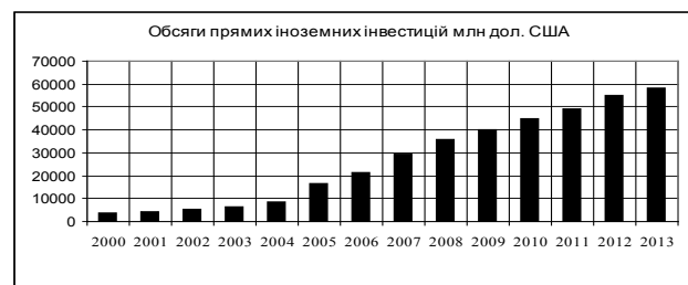
Рис. 1. Динаміка прямих іноземних інвестицій

Обсяги торгів цінними паперами залежать від багатьох факторів. Серед них, на наш погляд, доцільно виділити ВВП та обсяги прямих іноземних інвестицій. Так, із 2000 року до кінця 2013 року обсяги прямих іноземних інвестицій із країн світу в економіку України зросли на 54291,4 млн доларів США (рис. 1).