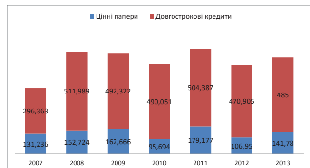
Рис. 1. Динаміка розвитку ринку капіталу, млрд. грн.

Для того, щоб комплексно проаналізувати тенденції розвитку вітчизняного ринку капіталів доцільно прослідкувати динаміку емісії інструментів ринку капіталів – цінних паперів та динаміку видачі довгострокових кредитів. Дані з рисунку 1. підтверджують тезу, що вітчизняний фінансовий ринок є банкоорієнтований, зважаючи на суттєве перевищення виданих кредитів перед об'ємами випущених цінних паперів. Динаміка показників показує, що обидва сегменти ринку капіталів однаково реагують на зовнішні та внутрішні стреси. Так за аналізований період видно два цикли зростання та спаду сегментів ринку. Перший підйом зафіксовано до 2008 року (511,989 млрд. грн., та 152, 724 млрд. грн. відповідно), наступний пік зафіксовано в 2011 році (504,387 млрд. грн., та 179,177 млрд. грн. відповідно). Станом на кінець 2013 року спостерігається зростання в обох сегментах на 2,99%, та 32,6% відповідно.