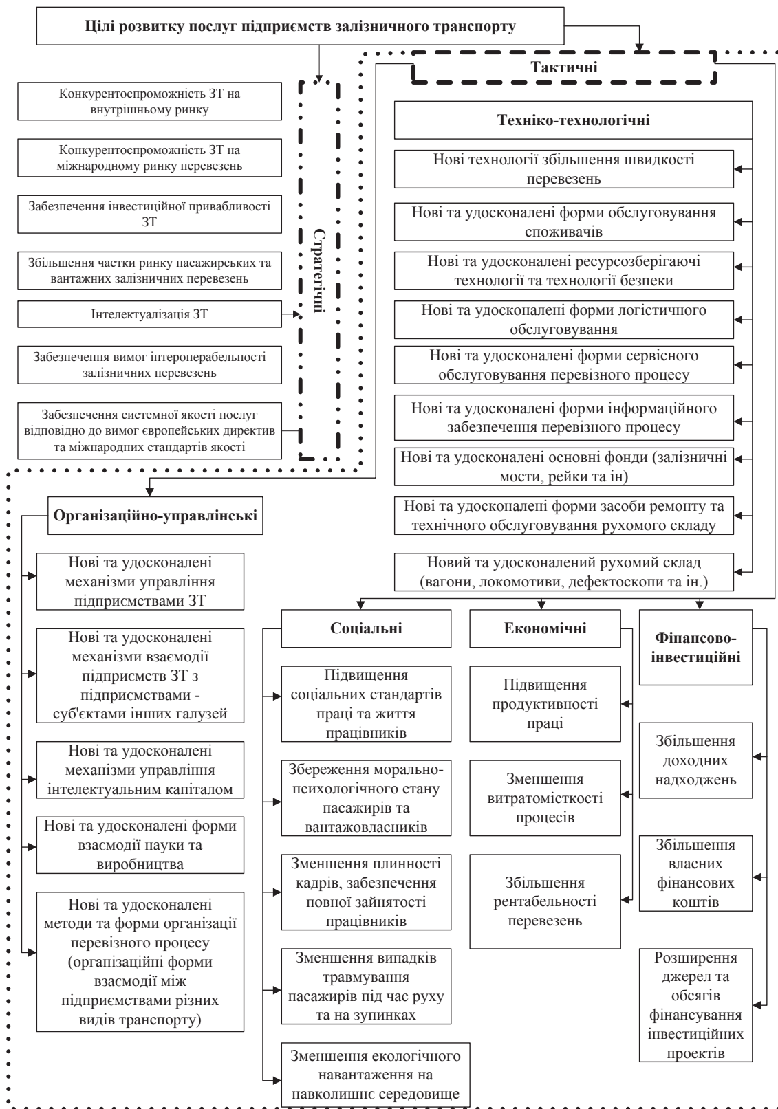
Рис. 2. Класифікація цілей розвитку послуг підприємств залізничного транспорту (авторська розробка)

Визначаючи першочергову роль маркетингової діяльності в справі удосконалення та розвитку транспортних послуг, В.М. Борщ пропонує в якості факторів визначати такі, які впливають на просування