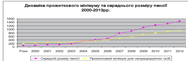
Рис. 2 Динаміка прожиткового мінімуму та середнього розміру пенсії 2000–2013 рр. [4], [3]

ки офіційні дані, значна кількість пенсіонерів зайнята в неформальних секторах економіки [4].