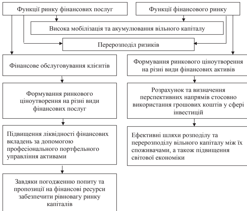
Рис. 1. Порівняльна характеристика функцій ринку фінансових послуг та функцій фінансового ринку