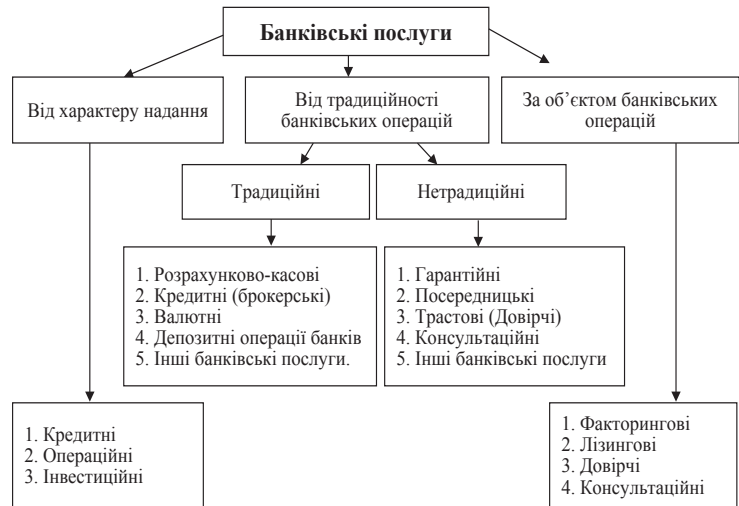
Рис. 3. Класифікація банківських послуг

Разом з тим не слід скидати з рахунків той факт, що з об'єктивної точки зору інтерес фінансового посередника полягає у залученні якомога більшої кількості грошових коштів та найприбутковішим їх розміщенням, тоді як «інтерес споживача фінансової послуги міститися в отриманні фінансових ресурсів, щоб у майбутньому мати додатковий відсоток від прибутку» [7, с. 27].