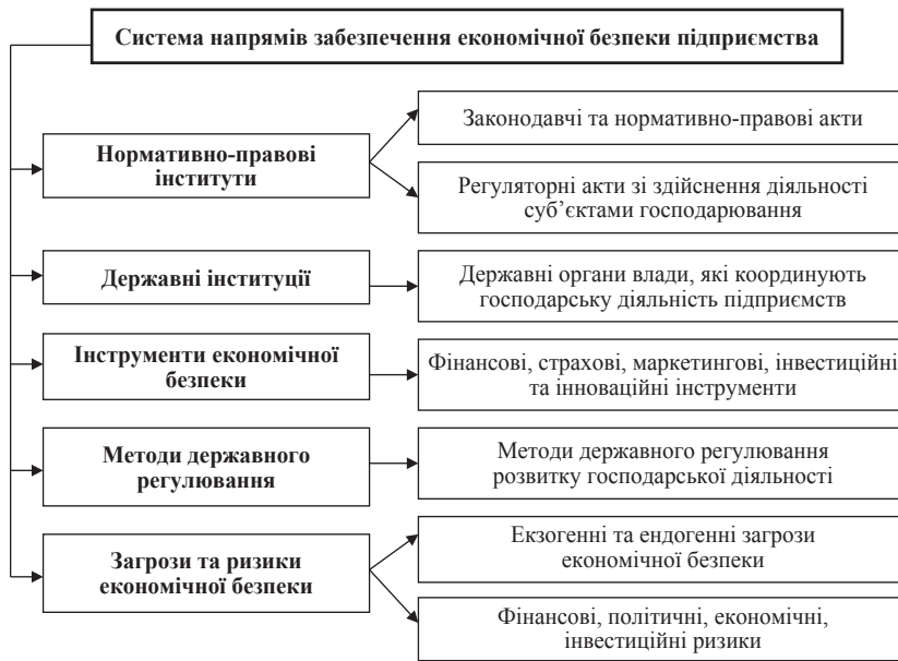
Рис. 3. Напрями інституціонального забезпечення економічної безпеки вугільного підприємства

Небезпеки і загрози економіці підприємства залежно від джерел виникнення класифікуються на об'єктивні та суб'єктивні. Об'єктивні виникають без участі і волі підприємства чи його персоналу, незалежні від прийнятих рішень, дій менеджера. Це стан фінансової кон'юнктури, наукові відкриття, форс-мажорні обставини тощо. Вони розпізнаються та враховуються в управлінських рішеннях. Суб'єктивні загрози породжені навмисними або ненавмисними діями людей, різних органів і організацій, в тому числі державних і міжнародних підприємств-конкурентів. Тому їх запобігання пов'язане з впливом на суб'єктів економічних відносин.