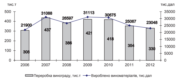
Рис. 1. Динаміка переробки винограду та виробництва виноматеріалів

Провідні учені і фахівці стверджують, що Україна повинна перейняти світовий досвід при висадці сортів винограду на певній місцевості. Для цього, на думку експертів, необхідно створити карту виноградарських регіонів і дати їй науковий супровід. На сьогодні у цьому напрямі працюють співробітники Національного наукового центру «Інститут виноградарства і виноробства ім. В.Е. Таїрова» НААН України. У травні 2013 р. учасники Всеукраїнської наради виноградарів та виноробів «Розвиток виноградарства в малих та середніх господарствах України та на його основі терруарного господарства з використанням французького досвіду» в результаті дискусії та вільного обміну думками прийшли до висновку, що галузь виноробства та виноградарства перебуває в незадовільному стані та потребує серйозної уваги з боку держави. Практично припинилася реалізація державних програм розвитку галузі, створено непрохідні перешкоди для українських виробників виноградарської та виноробної продукції, особливо для малого та середнього бізнесу. Кількість підприємств, що випускають виноробну продукцію, неухильно зменшується. За підсумками 2012 року тільки півсотні українських виробників вина скористалися ліцензією на право оптової торгівлі [9]. Обсяги переробки підприємствами винограду на виноматеріали у 2012 р. склали 329,6 тис. т, що на 24,3 тис. т, або на 7% менше, ніж у 2011 р.; виноматеріалів ви-