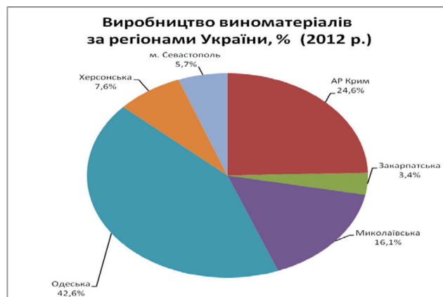
Рис. 2. Виробництво виноматеріалів за регіонами України у 2012 р., %

У той же час Одеський регіон є лідером в Україні з виробництва шампанських та ігристих виноматеріалів, що є вагомим ресурсом у винних дегустаціях туристів та розвитку туристичного напрямку (див. рис. 3).