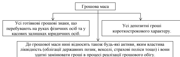
Рис. 3. Сукупність грошової маси [7]

Грошова маса має певний кількісний вираз, надзвичайно складну структуру та динаміку руху. З точки зору якісної характеристики грошової маси важливе значення має її структура, а з погляду практики її регулювання – динаміка руху обсягу та зміна структури.