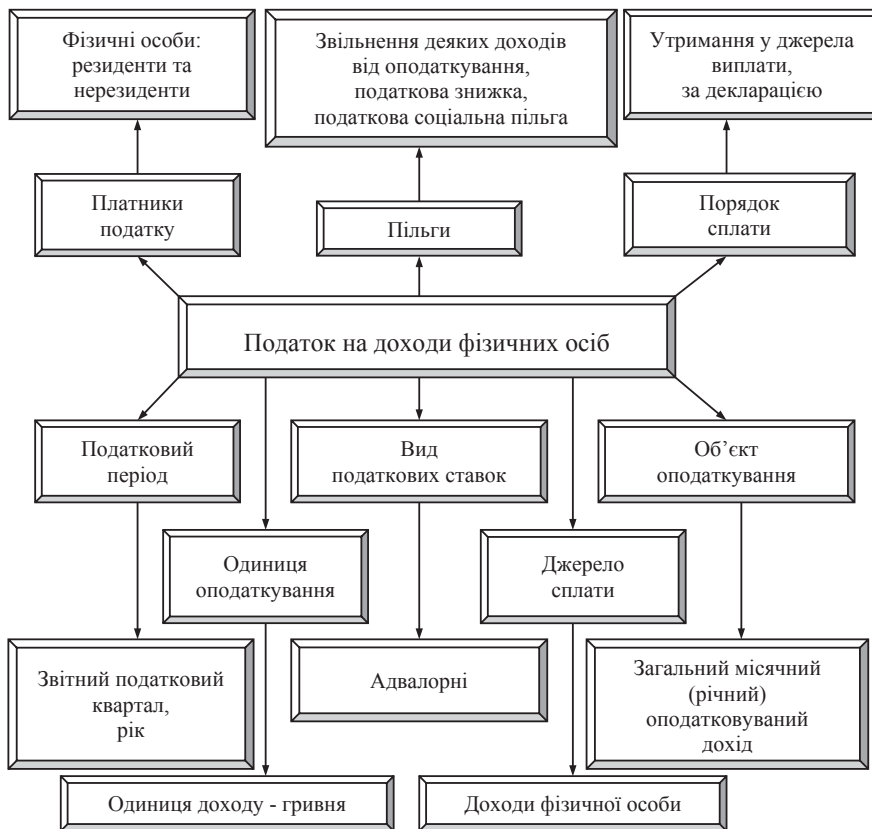
Рис. 1. Загальна характеристика податку на доходи фізичних осіб