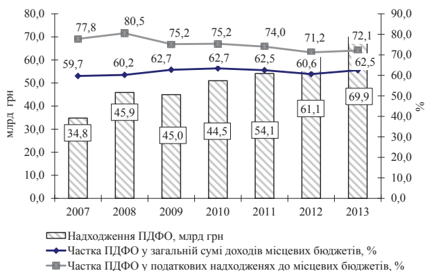
Рис. 3. Роль податку на доходи фізичних осіб у формуванні доходів місцевих бюджетів України (без урахування міжбюджетних трансфертів)

Як видно з даних рисунка 3, податок на доходи фізичних осіб відіграє основну роль при формуванні доходів місцевих бюджетів. Його частка у загальній сумі доходів місцевих бюджетів України з 2007 року (59,7%) по 2010 рік (62,7%) мала тенденцію до зростання після реформування механізму справляння податку. У 2012 році порівняно з 2011 роком частка податку на доходи фізичних осіб у загальній сумі доходів місцевих бюджетів України скоротилася до 60,6%.