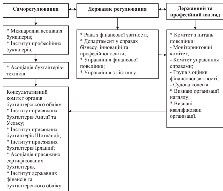
Рис. 2. Модель регулювання професії бухгалтера у Великій Британії

Наглядова складова англійської регуляторної моделі професії бухгалтера представлена Комітетом з питань поведінки Ради з фінансової звітності, який