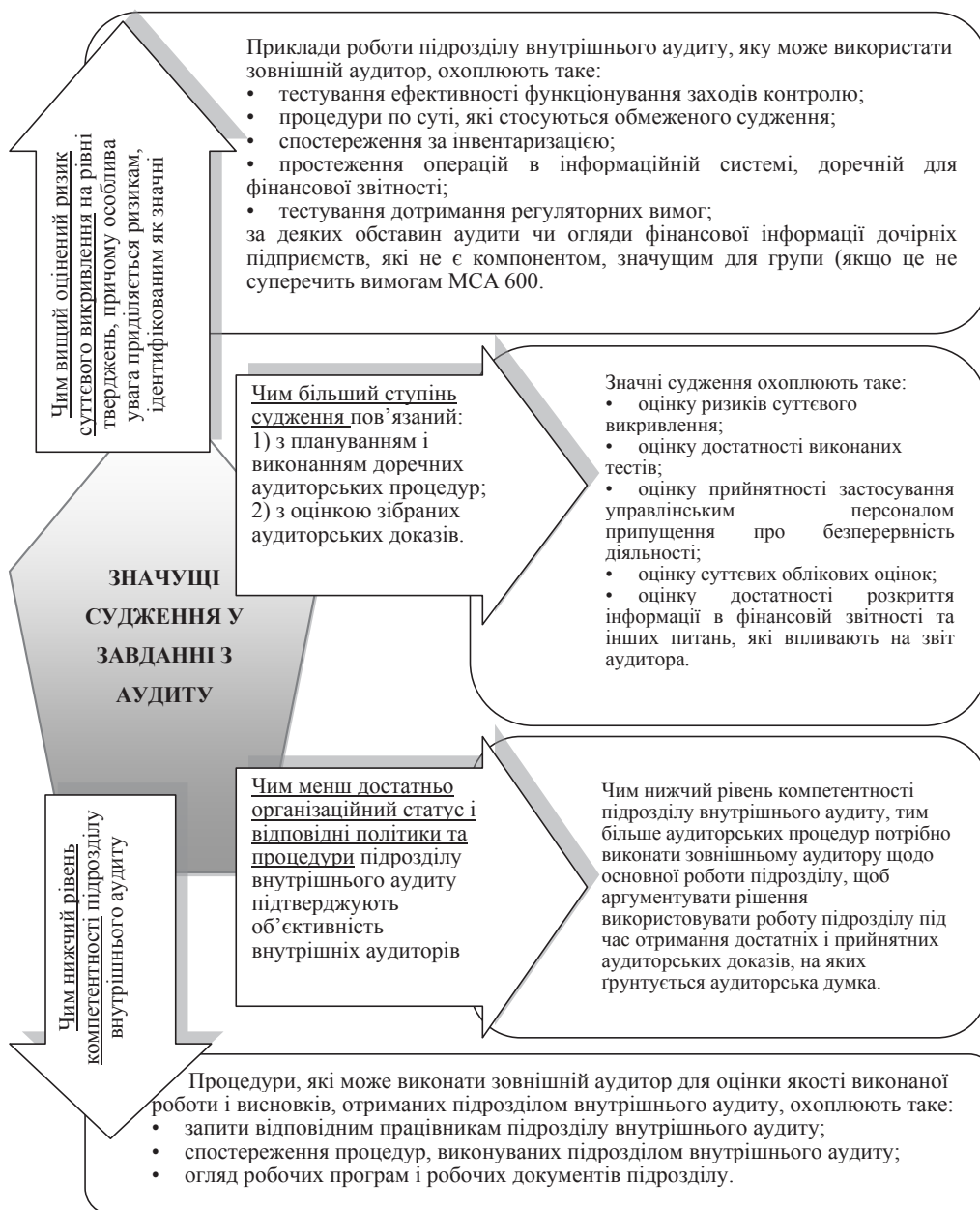
Рис. 2. Чинники, які впливають на визначення характеру та обсягу роботи підрозділу внутрішнього аудиту відповідно до Матеріалів для застосування та інших пояснювальних Матеріалів Д.15-22 «Визначення характеру та обсягу, в якому можна використати роботу підрозділу внутрішнього аудиту» МСА 610 «Використання роботи внутрішніх аудиторів» (переглянутого)

Процедурами внутрішнього аудиту є: вивчення засновницьких документів підприємства; дослідження первинної документації, реєстрів управлінського, бух-