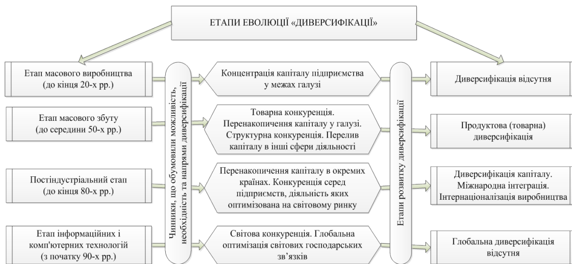
Рис. 1. Етапи еволюції диверсифікації

На наш погляд, для встановлення сутності поняття «диверсифікація» доцільно використати методологічні засади конструювання економічних понять і категорій А. Старостіної, за яких виокремлюються суть, зміст і результат явища [18].