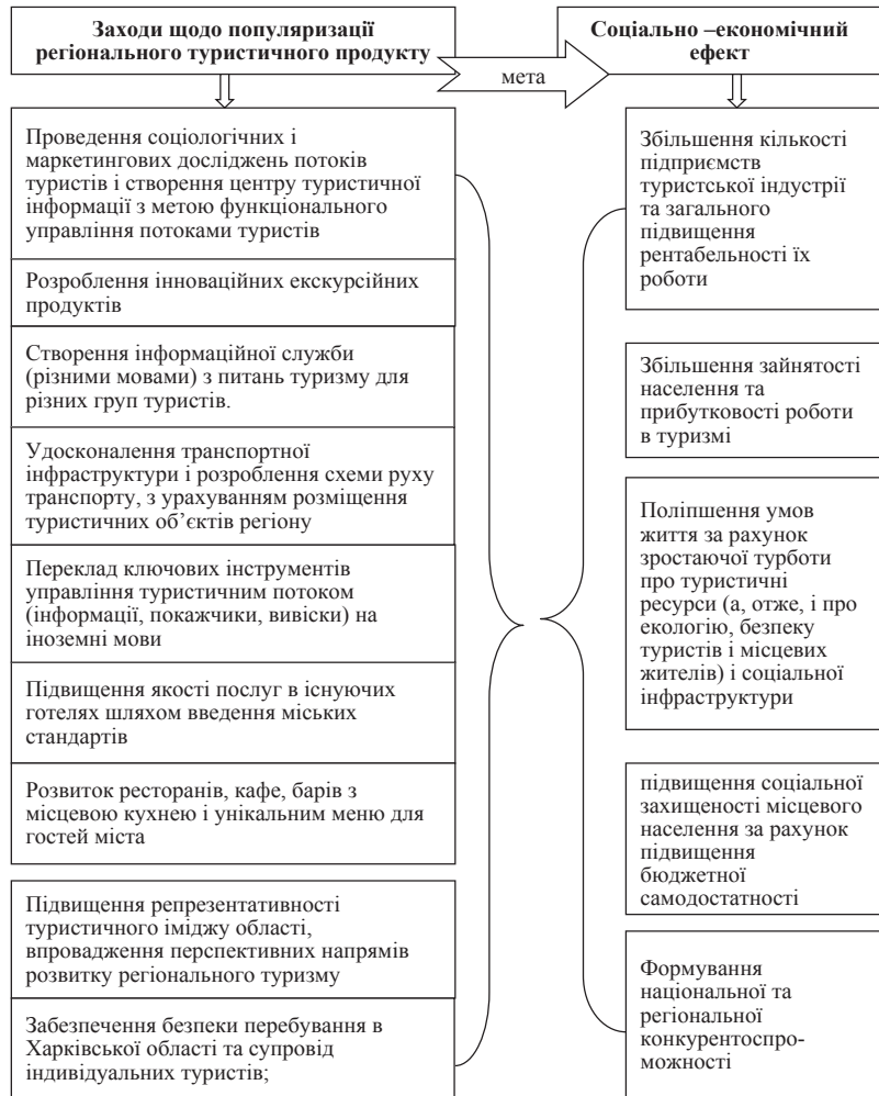
Рис. 5. Ключові заходи щодо популяризації регіонального туристичного продукту