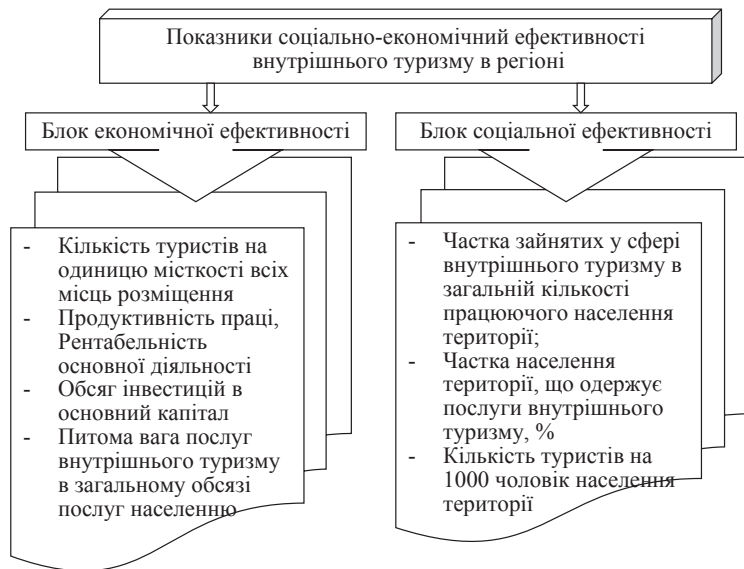
Рис. 3. Показники соціально-економічної ефективності внутрішнього туризму в регіоні