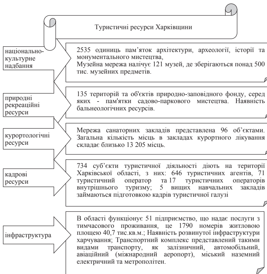
Рис. 1. Туристичні ресурси Харківщини

ним чинником розвитку туризму в регіоні. Територія тоді є привабливою, якщо вона має природно-рекреаційні ресурси та історико-культурний потенціал, розвинену матеріально-технічну базу, насичену інфраструктурою, зручне транспортно-географічне розташування і доступну про неї інформацією.