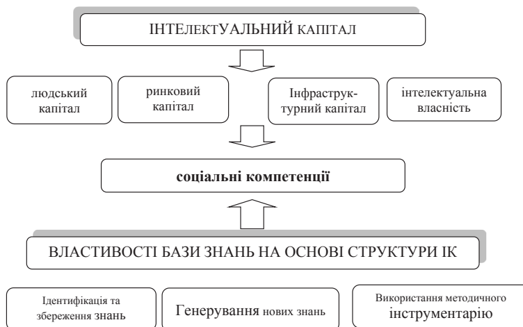
Рис. 1. Модель формування елементів соціальної відповідальності

Виклад основного матеріалу дослідження. Соціальною відповідальністю підприємницьких структур розглянемо як сукупність соціальних компетенцій, які структуруються відповідно до конфігурації інтелектуального капіталу. Соціальні компетенції персоналу відносяться до людського капіталу. Ринкові соціальні компетенції реалізують відносини з постачальниками, конкурентами та споживачами (наприклад, в питаннях ціноутворення, якості, охорони довкілля та сталого розвитку територій). Інфраструктурні соціальні компетенції визначають етику та культуру бізнесу. Зовнішні соціальні компетенції іміджевого типу відповідають за реалізацію