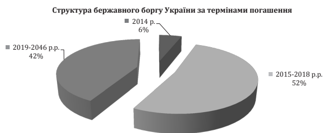
Рис. 3. Структура державного боргу України за термінами погашення станом на листопад 2014 року

Аналіз структури державного боргу України за термінами погашення засвідчив, що середній строк до погашення державного боргу станом на листопад поточного року становив 4,5 роки. Складність ситуації полягає тому, що 52% боргу повинно бути сплачено упродовж наступних 4-х років (рис. 3), а це – надзвичайно важкий тягар для економіки, враховуючи соціальну та політичну ситуацію в країні.