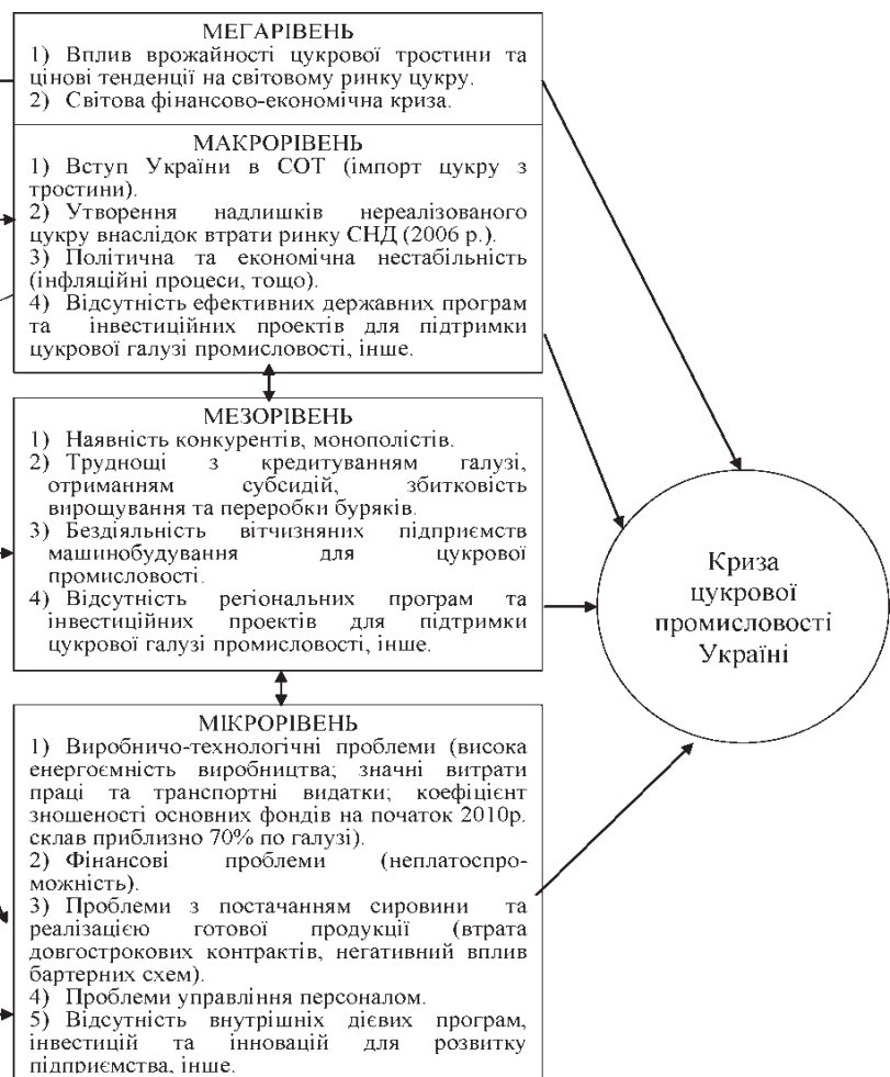
Рис. 3. Чинники виникнення кризових ситуацій на підприємствах цукрової промисловості України

пленими не були. При виникненні банкрутних явищ у судовому порядку в боржника вилучалось наявне майно. Цікаво, що обґрунтуванням боргу служила звичайна власноручна розписка. Стратегічні галузі промисловості завжди підтримувались з боку держави та мали великі обсяги дотацій, навіть, коли потрапляли в скрутну ситуацію. Це стосувалося й цукрової промисловості УРСР, яка завжди мала ринок