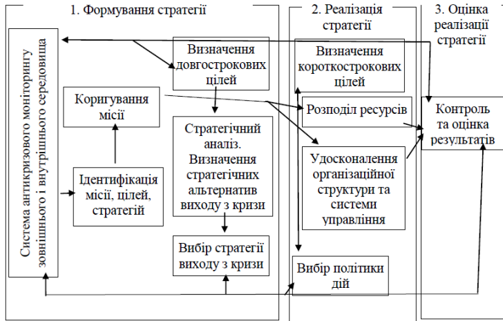
Рис. 2. Модель антикризового стратегічного управління підприємством

досягнення встановлених цілей. Підприємець, який більше зорієнтований на стратегічне управління сприяє змінам, невимушено йде на ризик, готовий опанувати нові горизонти, а зайнятий оперативним управлінням – сприймає зміни та ризик з обережністю, намагається поліпшити стан справ не змінюючи загального спрямування бізнесу, компетентно відносився до діагностики, координації та контролю підприємницької діяльності.