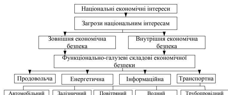
Рис. 1. Транспортна складова в забезпеченні національної економічної безпеки

Визначення масштабів, джерел, сфер, характеру прояву загроз дозволяє їх диференціювати, що сприятиме конкретизації заходів щодо забезпечення економічної безпеки.