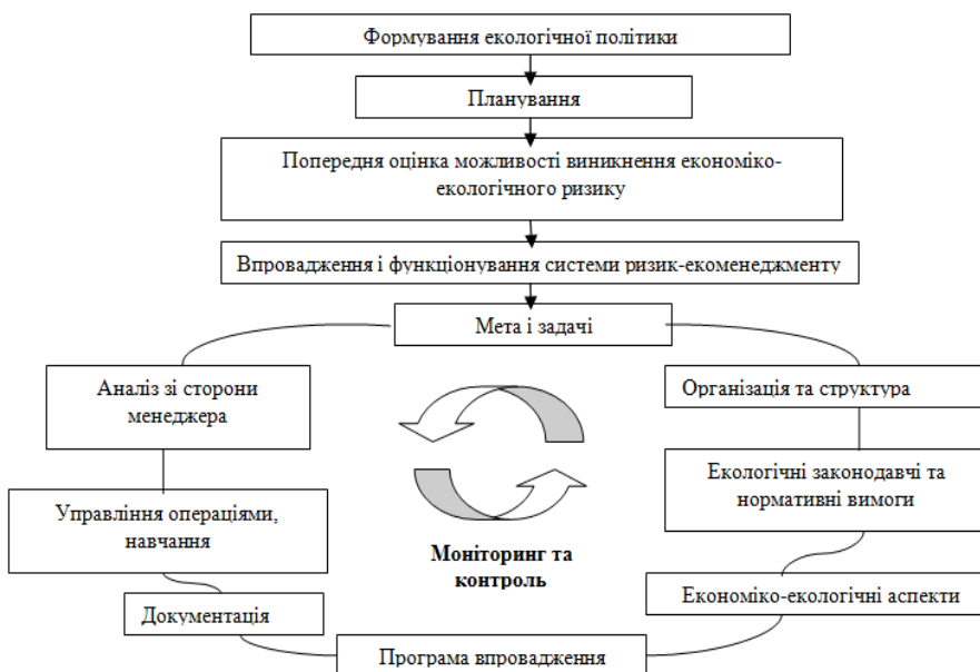
Рис. 1. Етапи впровадження та функціонування системи ризик-екоменеджменту

Прийнята структура повинна охоплювати менеджерами всі економіко-екологічні ризики. Вони, у