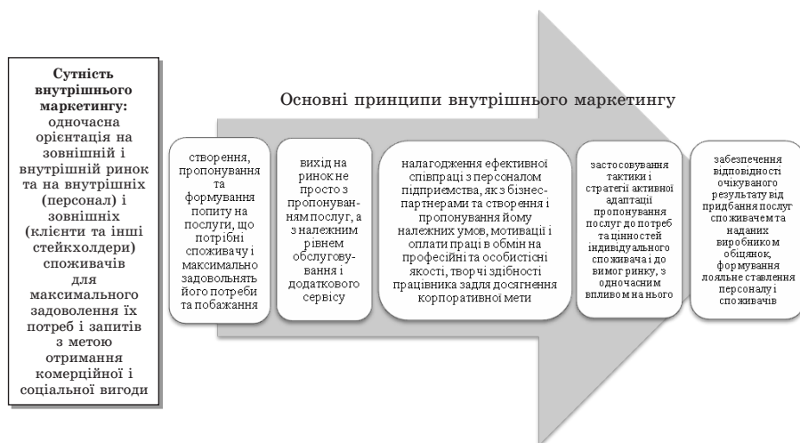
Рис. 1.2. Сутність та основні принципи внутрішнього маркетингу

працівників з метою ефективної реалізації корпоративної та функціональних стратегій. Внутрішній маркетинг розглядається як: сконцентрований на розвитку та реалізації високих стандартів якості обслуговування та задоволення клієнтів; стосується, в першу чергу, програм внутрішньої комунікації для забезпечення співробітників інформацією та завоювання їх підтримки; застосовується в якості систематичного підходу до управління прийняттям інновацій всередині організації; стосується стратегії впровадження маркетингових планів. Головним завданням внутрішнього маркетингу є створення умов і атмосфери взаєморозуміння між