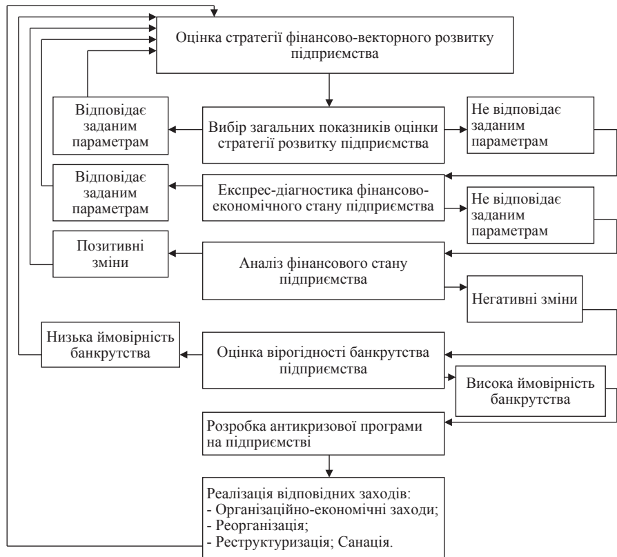
Рис. 2. Схема проведення оцінки стратегії фінансово-векторного розвитку

Останнім запропонованим і можливим антикризовим заходом, який передбачає оцінку результатів впровадження стратегії фінансово-векторного