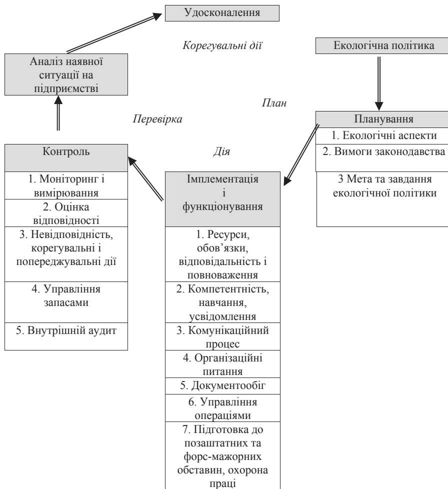
Рис. 2. Послідовність етапів впровадження екологічної політики на підприємстві (згідно з ISO 14001–2007)

– сформувати екологічно відповідальну поведінку персоналу, підвищити виробничу і технологічну дисципліну, розробити систему мотивації персоналу, що дозволить підвищити відповідальність